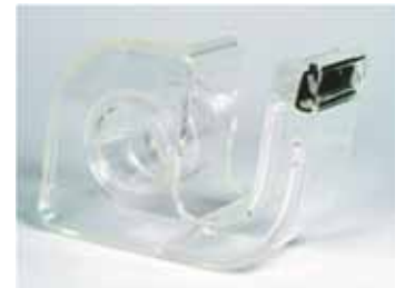
HK 19 M

Verarbeitung im Abroller / Apply with dispenser: